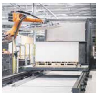
Industrielle Fertigung und Manufaktur ermöglichen die Herstellung maßgeschneiderter Unikate.

Die großformatige Porzellan-keramik mit einer Größe von bis zu 1,6 x 3,2 m wird passgenau zugeschnitten und vorgefertigt ausgeliefert. Ausschnitte und Kantenbearbeitungen sind individuell nach Kundenwunsch möglich und werden in der firmeneigenen Fertigung mit höchster Präzision hergestellt. Dabei ist es das Zusammenspiel aus industrieller Fertigung und Manufaktur, das die Herstellung handwerklicher Unikate (wie z. B. fertig verklebter Duschtassen, Waschbecken, Arbeitsplatten mit Ausschnitten) ermöglicht. Zuschnitte werden innerhalb von 48 Stunden ab Werk millimetergenau auf die Baustelle geliefert. Dieser hohe Grad an Vorfertigung bringt viele Vorteile für das Fachhandwerk mit sich.