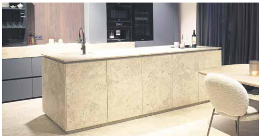
Der mit dem Plus X Award ausgezeichnete Monoblock aus dem Hause Ceraflex zieht im neuen Schauraum gekonnt alle Blicke auf sich. Die Ceraflex Keramik verleiht der Kochinsel ein nahezu fugenloses Design.

Neuer Schauraum zeigt Keramik in schönster Form für Küche, Bad, Raum und Außenbereiche