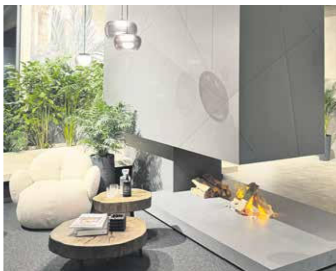
Der neue Schauraum zeigt die verschiedensten Einsatzbereiche der Großkeramik und liefert Inspirationen für Design und Gestaltung.

Individuelle Großkeramik für eindrucksvolle Räume: Dafür ist Ceraflex weit über die Grenzen Österreichs hinaus bekannt. Jetzt hat das innovative Unternehmen auch in Dorfen einen eigenen Standort mit Showroom eröffnet, um von hier aus den bayerischen Markt zu bedienen.