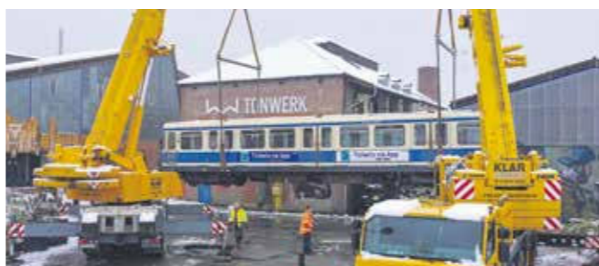
Geburts- oder Firmenfeiern werden künftig in der jüngst angelieferten U-Bahn möglich sein. Am Veranstaltungskonzept wird noch gearbeitet.

Freitags und samstags sowie vor Feiertagen lädt die Diskothek Heizwerk ab 23 Uhr zum Tanzen ein. Wer möchte, kann vorher in der Bricks Bar ab 19 Uhr vorbeischaun. Oder man zapft sich sein eigenes Bier in Pajo's Zapfbar (Donnerstag bis Samstag ab 19 Uhr). In der alten Schlosserei finden Hochzeiten, Firmenfeiern, Flohmärkte und andere Veranstaltungen statt. Im Escape Room können die