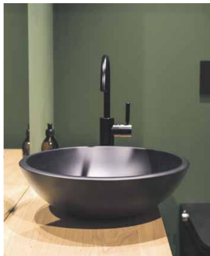
In dem Bäder & Wellness Store in Dorfen werden verschiedene aktuelle Badtrends präsentiert

Insbesondere in Zeiten geringer Neubauaktivitäten wird die Modernisierung vorhandener Bäder essenziell. Fliesen, Duscharmaturen und Waschbecken unterliegen Stil-Veränderungen und sollen neben einer zeitgemäßen Optik eine hohe Funktionalität gewähr-